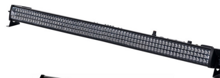
00028581 Showlite LED Stage Bar 216x10mm