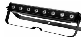
00028582 Showlite LED Stage Bar 8x3 Watt