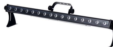
00028583 Showlite LED Stage Bar 16x3 Watt